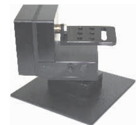
Outdoor Mini PTZ