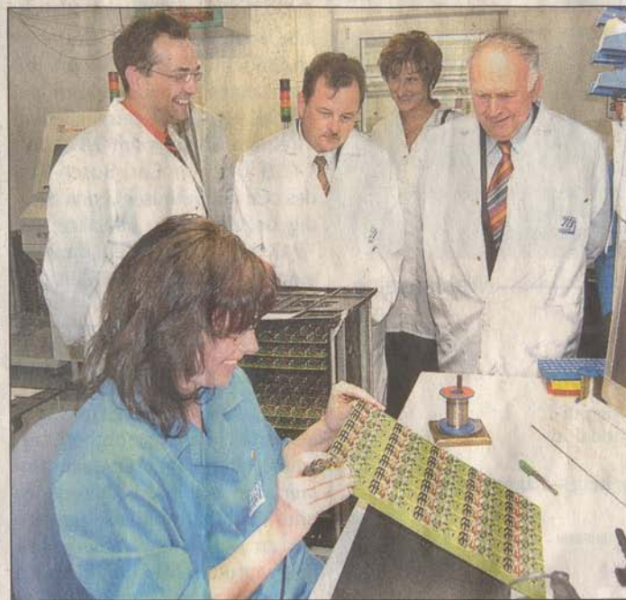
Besonders filigrane Arbeiten, wie das Lötten feinsten Verbindungen, ist eine Domäne der Frauen im Elektronik-Betrieb.

VTQ Videotronik erhielt zweimal den Innovationspreis des Landkreises Merseburg-Querfurt und war 2006 Finalist für den „Oscar des Mittelstandes“.